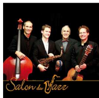
Künstler: Salon du Jazz Titel: Salon du Jazz Produktion: 2011 Label Code: LC 33187