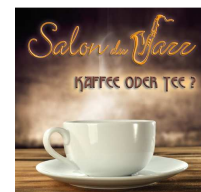
Salon du Jazz Kaffee oder Tee? 2015 LC 33187